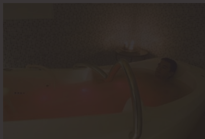
Calma total en el centro Salud y Natura, de Almuñécar

El mar es la vida. Al menos para tres españoles y un inglés que crearon en torno a 2002 una empresa de esas que sueñan los que piensan en retirarse en el fin del mundo. Su pasión, el buceo; su destino, Indonesia, un paraíso para los aficionados al surf y al buceo: 14.000 islas en el horizonte. Los tres españoles de Indocruises son buceadores, aunque proceden de distintos campos. Desde aquella idea inicial, que tenía tanto de aventura, han construido dos barcos, incluido el Mys Seahorse, en el que los especialistas indonesios trabajaron desde mediados de 2002 hasta 2005. Se trata de una goleta tradicional, de madera, pero con la tecnología más avanzada. El Mys tiene 33 metros de eslora y 8,5 de manga, con un interior cinco estrellas. Once tripulantes atienden a un pasaje de dieciséis clientes, alojados en cabinas de doce metros cuadrados. Los viajes suelen estar enfocados al buceo deportivo en la zona del mundo donde el arrecife es mayor y más interesante, con cuatro inmersiones al día, incluida una nocturna. Organizan también expediciones más «para todos los públicos», con visitas a los poblados de la costa o a la selva tropical, además de la posibilidad de obtener el título de buceo a bordo. El precio: los vuelos suelen rondar los 1.300 euros, más unos 280 euros por persona y día a bordo, en pensión completa. www.indocruises.com / 629.16.14.63 .