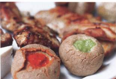
Bolas de gofio con mojo rojo y verde.