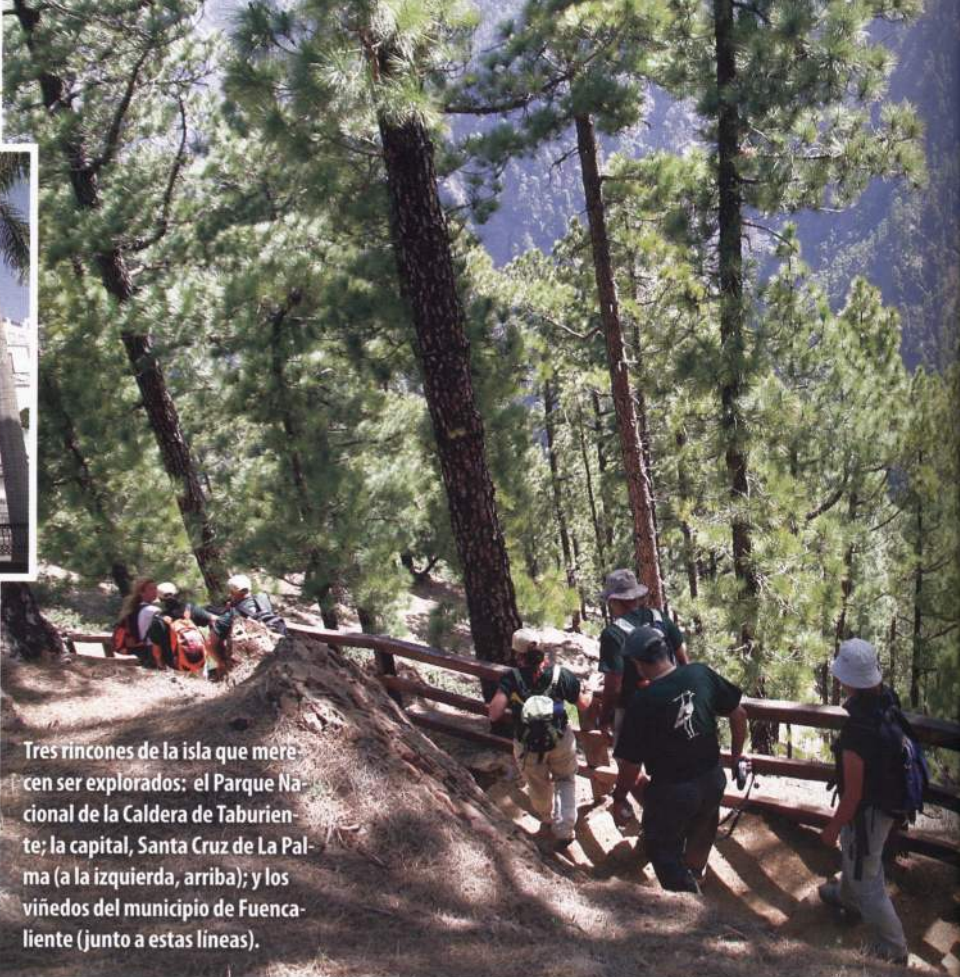
Tres rincones de la isla que merecen ser explorados: el Parque Nacional de la Caldera de Taburiente; la capital, Santa Cruz de La Palma (a la izquierda, arriba); y los viñedos del municipio de Fuencaliente (junto a estas líneas).