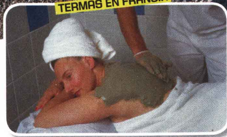
TERMAS EN FRANCIA