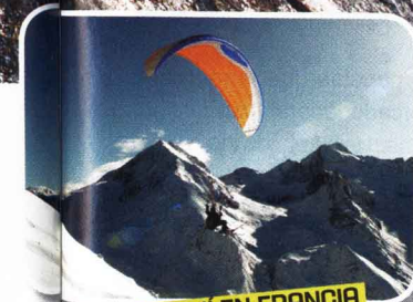
ESQUÍ EN FRANCIA